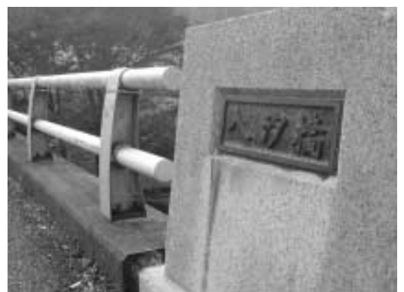
欄干の高さを満たしていない八汐橋

については、現在平成8年度にアスベスト全面使用禁止という規制基準が設定されているので、それ以前に建築されたすべての施設について調査しリストアップをしたところである。現時点での件数は、675棟である。今後、このリストをもとに、設計図書等及び目視により、使用の有無を確認する作業を進めていく。目視等によっても判断がつかないときには、専門の業者に分析を依頼し確認を行いたい。分析の進捗状況にもよるが、11月下旬を目途として、この実態把握を進めたいと考えている。問題が発生した場合の対策だが、アスベストの状況に応じ、適切な措置を行い、安全確保に努めたい。