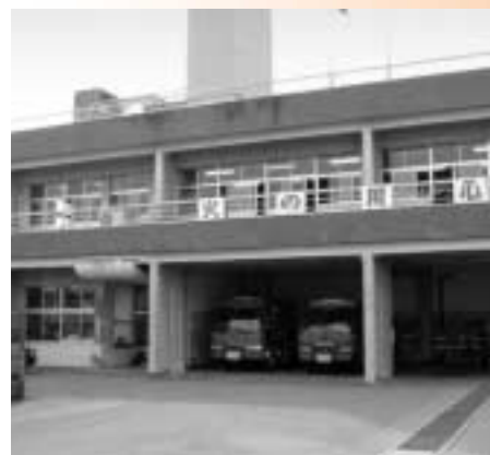
老朽化が著しい本部庁舎