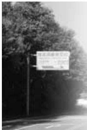
東那須産業団地入口付近

れ、流通産業や通信産業、商業系施設、企業、事務所等々も積極的に受け入れているという実情から、実態に合う名称に変更した。工業団地への進出企業が減少している現状から、製造業にこだわることなく多様な優良企業の受け入れが必要だと考えている。この地域の特性と時代の流れに合い雇用が促進され、地域活性化につながるような企業の立地が望ましいものと考えている。