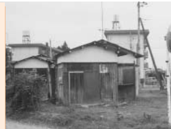
空き家となった市営住宅

Q 市営住宅の利用状況について伺いたい。古くて空きの目立つ住宅について、今後どのようにするつもりなのか。