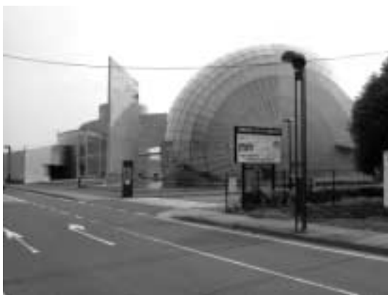
那須野が原ハーモニーホール

A 市長 寄付金、両市の運営資金元金を積み立てている状況は承知している。財政状況が大変厳しい中、2億円以上かかるという話も聞いているので、合併記念というような形では考えることはできない。