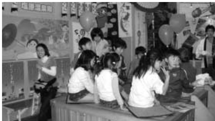
塩原温泉の開湯1200年を「足湯」でPR ーとちぎフェスタ2005特設会場ー

A 総務部長 納税貯蓄組合法で規定される要件に照らして、疑義が生じてきた。旧塩原町において廃止することが決定されており、今後制度の復活はない。