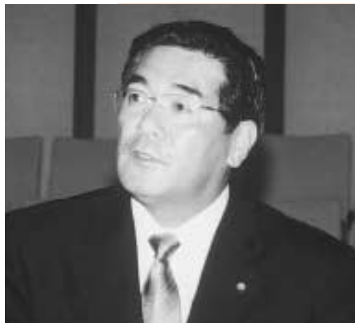
代表 水戸 滋議員