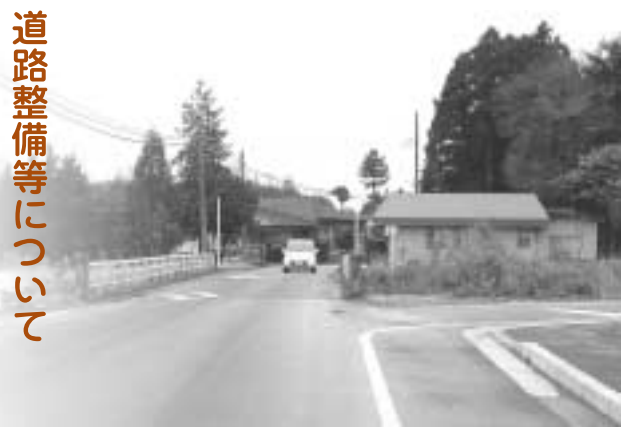
早期整備が求められている学校橋

A 建設部長 ①学校橋からBS栃木工場までの道路整備については、学校橋の整備を優先に検討していきたいと考えている。 ②路面架けかえの年次計画については、3年ぐらいの短期的な計画を毎年度の財政状況を見ながら見直ししていくような計画を、今後研究していきたいと考えている。