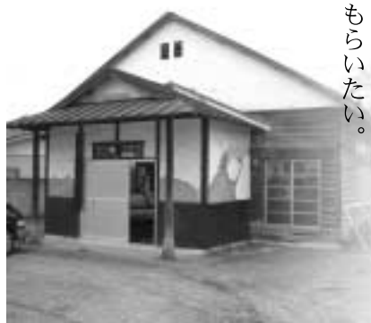
黒磯中学校柔道場

上で1000万円を限度とした補助金制度があるので、その制度を利用してもらいたい。