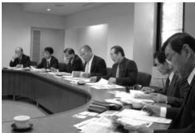
松本市美術館の運営について説明を受ける委員会メンバー

松本市では松本市美術館の運営全般と運営に対する市民の関わり方について、長野市では平成18年4月から市に導入される指定管理者制度に係る市有施設の管理運営方針について、須坂市では須坂市文化会館「メセナホール」の運営全般と運営に対する市民の関わり方などについて視察を行いました。