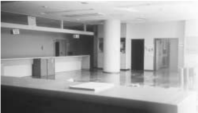
教育委員会、水道部が西那須野庁舎へ移転。 写真は西那須野庁舎の空きスペース