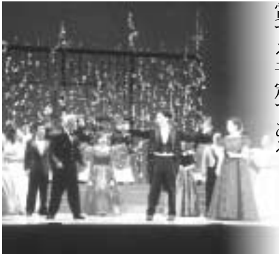
1月末に黒磯文化会館で行われた「市民のオペラをつくる会」による公演の様子

A 教育部長 那須塩原市では市内の児童・生徒に対する芸術文化教育の一環として、音楽・演劇鑑賞教室を実施している。今年度は市内の中学2年生全員を対象に「市民のオペラをつくる会」による公演を鑑賞する予定である。