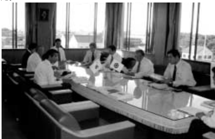
彦根市の環境基本計画及び地域行動計画の説明を受ける委員会メンバー

所沢市では国立身体障害者リハビリテーションセンターにおける事業内容について、世田谷区では東京農業大学リサイクル研究センターのエコテックゾーンプロジェクトなどについて、彦根市では環境基本計画及び地域行動計画について、能登川町では埋蔵文化センター内の図書館における事業運営について視察を行いました。