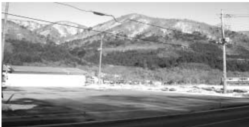
塩原支所の建設予定地と隣接する空き地

A 教育部長 スポーツ少年団17チーム533人、中学校部活動10チーム370人、硬式少年野球1チーム30人、高等学校部活動4チーム144人、体育協会加盟団体89チーム1504人、合計121チーム2581人である。生涯スポーツの振興を第1の目的として検討したい。