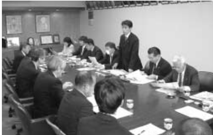
開湯1200年祭を共に意義あるものにしたいとあいさつする委員長

犬山市では、国宝犬山城を中心とした観光・誘客対策や構造改革特区などについて、七尾市では全国的にも有名な和倉温泉の温泉資源をいかした観光、産業活力づくりの取り組みについて、七尾市和倉温泉観光協会では塩原温泉同様、平成18年に開湯1200年を迎える和倉温泉における観光PR、具体的な誘客対策事業などについて視察を行いました。