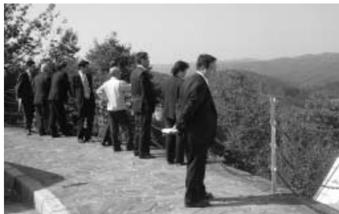
播磨科学公園都市を視察する委員会メンバー

西宮市では阪神・淡路大震災で壊滅的な被害を受けた阪急西宮北口駅北東地区の市街地再開発の取り組みなどについて、上郡町では21世紀の科学技術の発展を支える国際的な都市整備が進められている播磨科学公園都市について、高砂市では市民の緑化意識の高揚、知識の普及を図り、都市緑化を推進している市の池公園整備について視察を行いました。