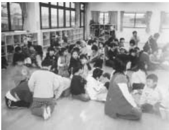
大山児童クラブでの保育の様子

A 市民福祉部長 基本的に、黒磯地域の9つの児童クラブについては、運営主体が保護者会で、任命権者も保護者会の会長であり、これについての考え方は、市では持ち合わせていない。西那須野・塩原地域は、非常勤特別職、あるいは臨時職員という位置づけであり、当面、そのままの形でいくという考えである。