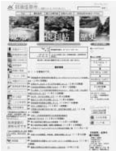
現在の市のホームページ画面。 検索しやすいトップメニューの工夫が求められている。

A 企画部長 現在のホームページは、トップページの各種行政情報が分野別に分かれていないことから、知りたい情報を容易に検索し