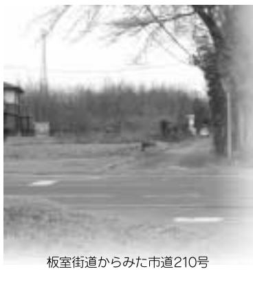
板室街道からみた市道210号

A 建設部長 当然18年度の予算として要求していきたい。1日も早く完了したいと考えている。