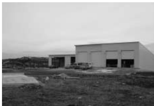
来年度の稼働に向け建設が進められている堆肥センター

A 市長 3支所が並列であるという組織上の弊害、行政効率上の問題などから、本庁機能を取り入れた、より行政効率のよい組織を平成18年度から立ち上げることに検討を加えているところである。