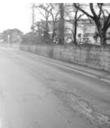
朝夕の通行が多い那須拓陽高校前