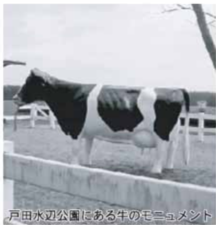
戸田水辺公園にある牛のモニュメント

答 産業観光部長 観光協会の中で検討中で、その結果がまとまれば、市に対してそれなりの要請が出てくると思うので、その時点で検討していきたい。