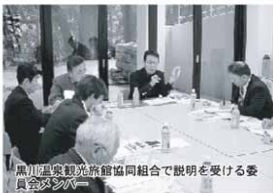
黒川温泉観光旅館協同組合で説明を受ける委員会メンバー