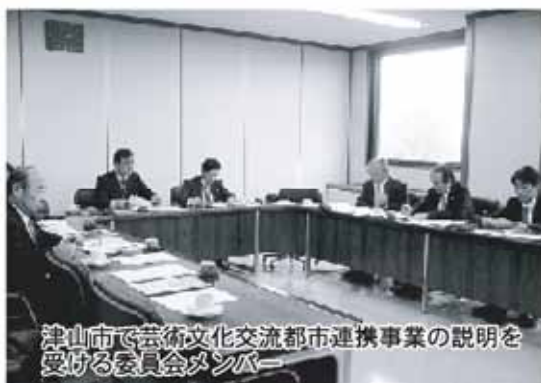
津山市で芸術文化交流都市連携事業の説明を受ける委員会メンバー