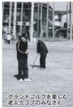
楽しむ 老人クラブのみ ゴルフを グラウンド

答 市民福祉部長 スポーツ活動も事業に含まれ、申請の段階で交付対象にするか決めるようになる。