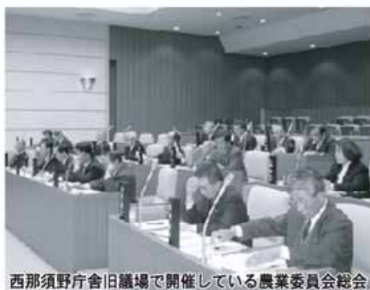
西那須野庁舎旧議場で開催している農業委員会総会

問 今年6月から毎月の総会を西那須野庁舎旧議場に開催しているが、現在までの取り組み状況について、また、これを踏まえた今後の農業委員会のあり方について伺う。