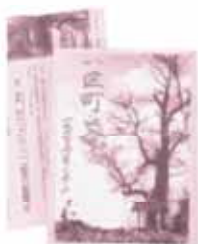
H16年9月1日に発行された1区町史

答 市長 大変貴重なお話を聞かせていただいた。そういう面も含め、今後検討させたいと考えている。