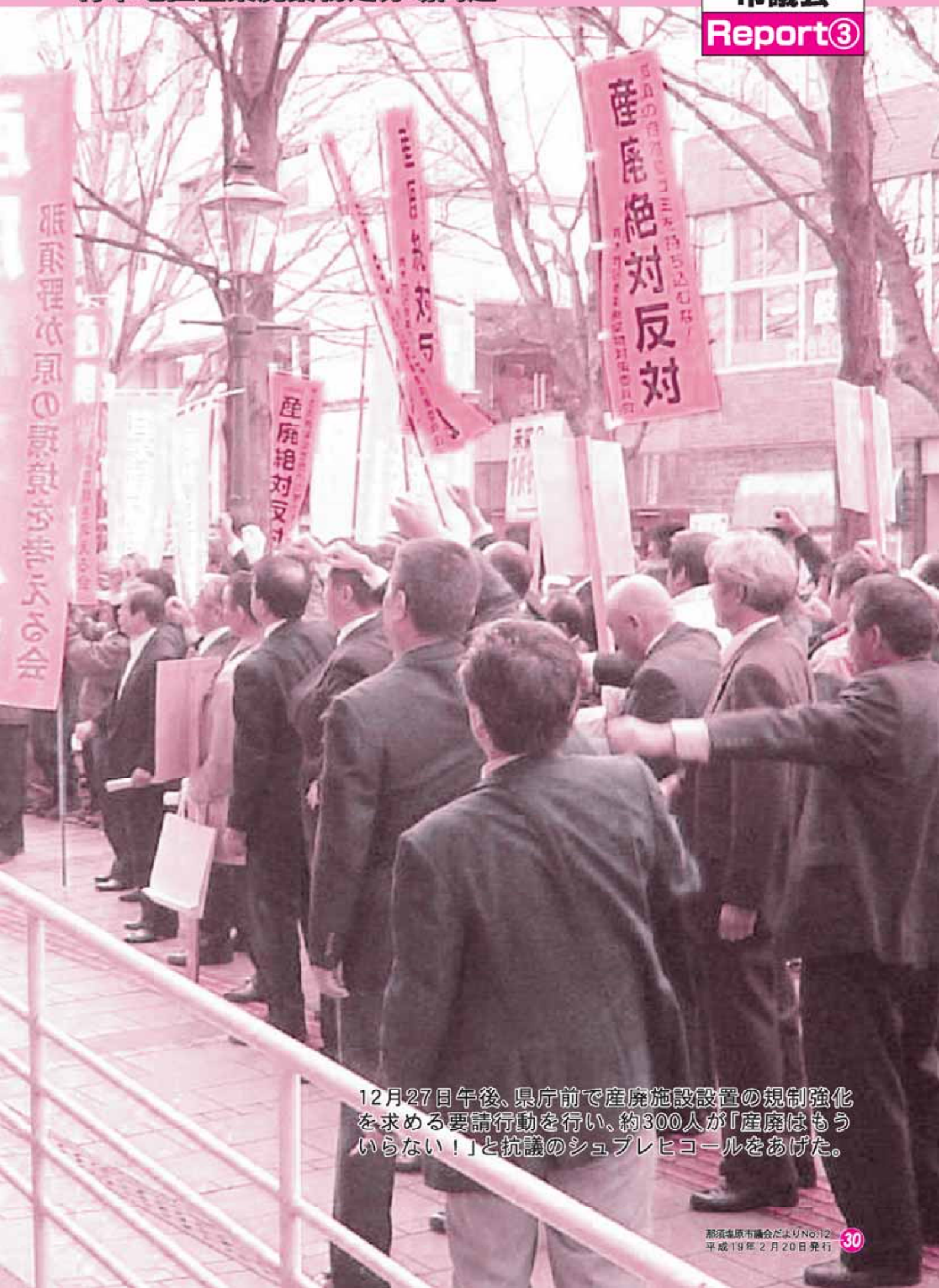
12月27日午後、県庁前で産廃施設設置の規制強化を求める要請行動を行い、約300人が「産廃はもういらない！」と抗議のシュプレヒコールをあげた。