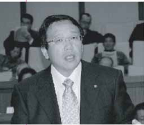
眞壁 俊郎 議員