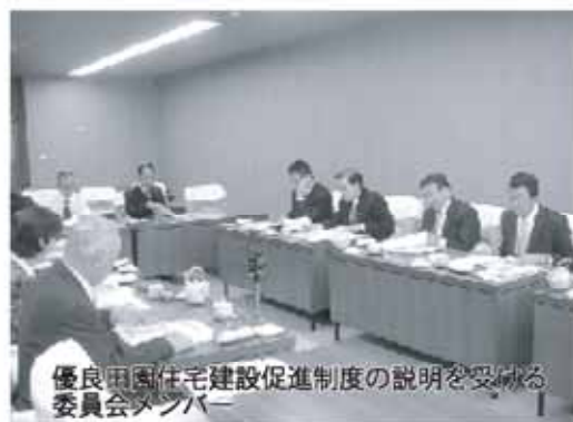
優良田園住宅建設促進制度の説明を受ける委員会メンバー

鹿児島市ではソフトプラザかごしまの建設と運営状況について、また、優良田園住宅建設促進制度について、さらに、出水市では平成16年3月に一部開通した九州新幹線、出水駅の周辺開発について視察を行いました。