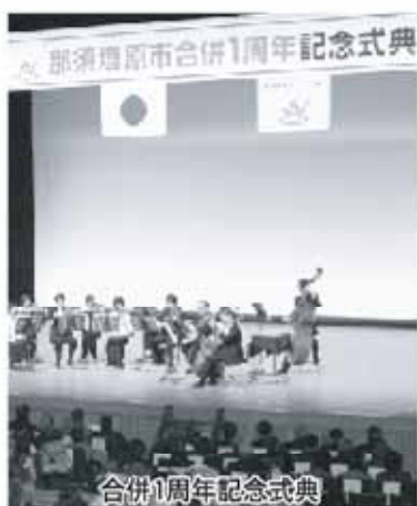
合併1周年記念式典

答 企画部長 今年度は表彰式、だけ開催で、表彰者62名のほか、来賓として国会議員、県議会議員、