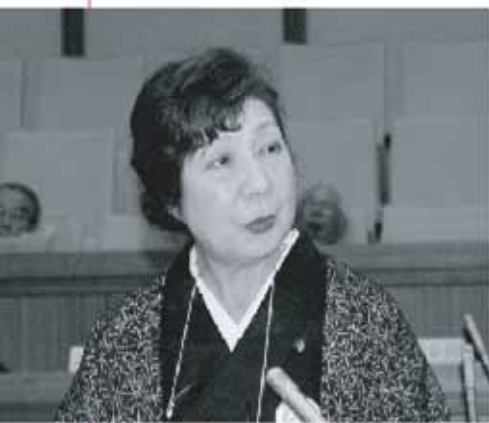
岡部 瑞穂 議員