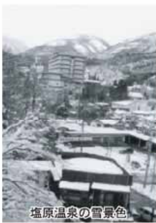
塩原温泉の雪景色

答 総務部長 環境衛生施設、消防施設、観光施設等の整備に充てるために課する目的税である。このほか塩原温泉開湯1200年記念事業や観光協会事業補助金などに充て観光振興を図っている。