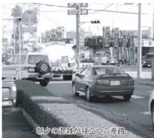
朝夕の混雑が目立つ六差路