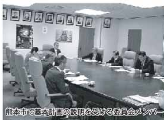
熊本市で基本計画の説明を受ける委員会メンバー

水俣市では、産廃最終処分場建設に伴う行政・議会の対応について及び水俣エコタウンについて、八代市では、八代市立博物館「未来の森ミュージアム」の概要について、熊本市では、ごみ減量・リサイクル推進基本計画について視察を行いました。