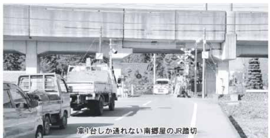
車1台しか通れない南郷屋のJR踏切

答 建設部長 今年度工事完成を目指し、昨日入札が行われ、施工業者が決定した。今年度で整備計画区間が完了となる予定になっている。