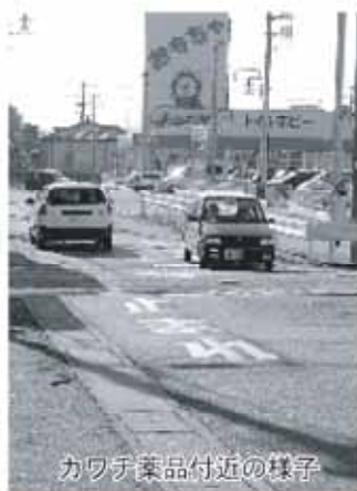
カワチ薬品付近の様子

問 大黒町から末広町のカワチ薬品前に通じる市道を、大型車が侵入できるようにする道路拡幅事業の見通し、当初の計画内容は。また、用地取得の見通しは。