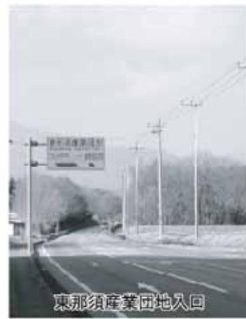
東那須産業団地入口

対処策をどのように考えているか。 答 産業観光部長 交通協議の中で、周辺環境への配慮と交通渋滞を招かないよう指導をしていきたい。