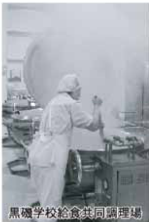
黒磯学校給食共同調理場

答 教育部長 払えるのに払えないという部分では、17年度の調査結果で約半分、50%の方がそういう方々。ちなみに経済的理由が約30%ということである。