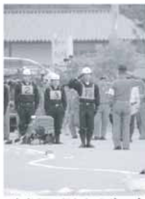
毎年夏に行われるポンプ操法競技会

答 教育長 私たちの生活の安全を守る地域に根差した消防団活動は、意義深いものと考えており、訓練に取り組み姿にも感銘を覚える。市内の小中学校ではボランティア活動を奨励しており、体験活動を通して、社会の一員としての資質の向上や豊かな心、感性の育成に努めており、学校教育においてどのような教育効果をもたらすものなのかについて、今後考えていきたい。