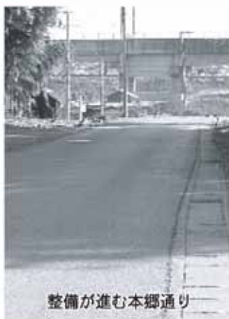
整備が進む本郷通り

都市計画道路3・4・1本郷通り街路事業に伴う東北新幹線及び東北本線アンダー工事の施行に関する業務について、東日本旅客鉄道株式会社と協定を締結するものです。