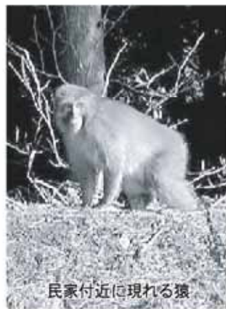
民家付近に現れる猿