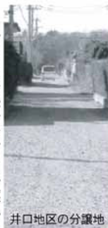
井口地区の分譲地

問 市内には私道負担の旧分譲地も数多く点在している。その中で特に井口地区、帯根地区の分譲地は広い地域に戸数も多く、また、年々新たな住宅も増えており、今後の発展が大変期待されている地域である。地元の多くは住宅地内の砂利道を何とか舗装していただきたいとの切実な要望がある。現代の車社会にあって、この先舗装の見通しがつかない道路行政であるならば、何とも理解しがたいというのが地域住民の率直な気持ちである。一日も早くこの砂利道が舗装に、一歩でも前進につながるような答弁をいただきたい。 答 建設部長 現在、市道及び市管理道路以外の私道の整備を支援する制度として、私道等整備支援要領を定めており、砂利道を舗装する場合や老朽化により再舗装する場合などが支援の対象になる。支援内容については、工事原材料のうちアスファルト合材、碎石等を支給するもので、支給品の限度額は100万円、また私道等維持補修基準を定め、砂利道における敷き砂利等、軽微な維持補修も申請により実施している。