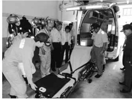
塩原分署視察の様子

各消防署では、施設や車両設備などを中心に視察し、現在の状況と今後の課題を確認した。