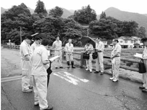
明神橋現況確認の様子