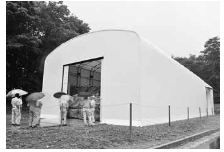
那須塩原クリーンセンター敷地内の テント倉庫