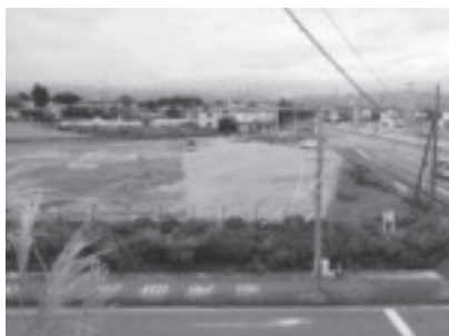
とよورا保育園建設予定地(旧那須塩原警察署跡地)

答弁 今年度中に土地の契約と移管事業者を決定し、26年度に設計、27年度に建設し、28年度オープン予定である。