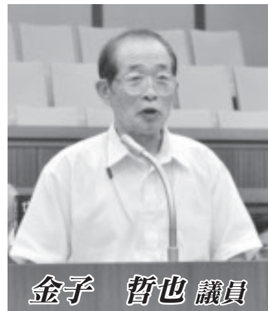
金子 哲也 議員

問 那須塩原市の将来を考える時に、20年、30年、さらに50年を視野に入れた上で現状の問題やこれからの課題に取り組んでいかなければならない。那須塩原市の住み良さ、利便性、快適さ、文化などを、今後どのように伸ばしていくのか。 答 市長 将来の人口減少、超高齢化社会の到来による生産年齢人口の減少や、老年人口の増加を見据え、限られた予算の中で漫然とした施策を実施していくのではなく、持続可能な社会の構築を進めていくためにも、前例にとらわれずに、積極果敢に変革に臨む。そのために、考え方が内向きから外向きへの施策になるよう心掛けていくが、外部との接触を多くして、気づきの政治を行うための条件を整えて実践したいと考えている。具体的には、公益法人ふさと財団の地域再生マネジャーによ