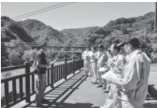
塩原ダム湖視察の様子