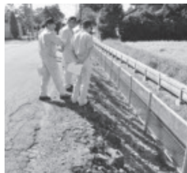
市道N2-11（加治屋堀線） （建設水道常任委員会現地調査）