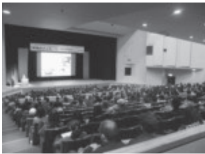
昨年の講演会の様子

答弁 講演会の場所や日程等については、これから検討するが、昨年2月に黒磯文化会館で行い450人が参加した。たくさんの方に聞いて欲しいと考えている。