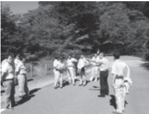
旧国道400号視察の様子 (回顧園地付近)

委員からは、学生や県の河川ボランティアを活用することなど、草刈りに対する提案のほか、地域の宝である様々な観光資源を活用することで、塩原を1分1秒でも長く滞在して頂けるような魅力ある地域とするため、塩原温泉観光協会の皆さんと共に真剣に取り組んでいきたいとの意見がありました。