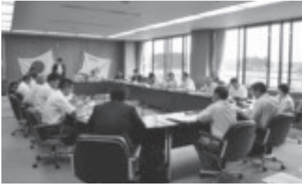
栃木県さくら市議会との意見交換会の様子

双方で活発に意見が交換されるなど、受け入れた当市議会にとって、他議会の運営や取り組みを知る貴重な機会となりました。