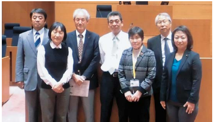
【所管事務調査 (東京都町田市・議場にて)】

去る11月7日から8日には、所管事務調査のため、東京都町田市を訪れ、新庁舎建設の経過や議会の対応などについて視察を行いました。また、東京臨海広域防災公園では、防災体験学習施設で地震災害への備えについて学び、同公園で行われた全国消防操法大会を見学、市内消防団の活躍を応援しました。