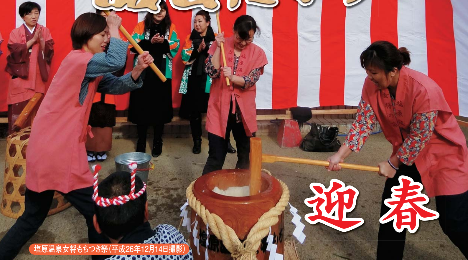
塩原温泉女将もちつき祭(平成26年12月14日撮影)

新年号 (第55号) 平成27年1月5日発行 栃木県那須塩原市 議会だより編集委員会 議会事務局 TEL0287-62-7181