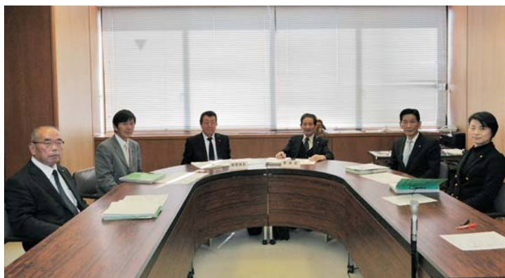
～議案審査終了後の委員会室にて～

今後においても、身近で行われている様々な取組に目を向け、地域の特色を生かした施策の実現に努めてまいります。