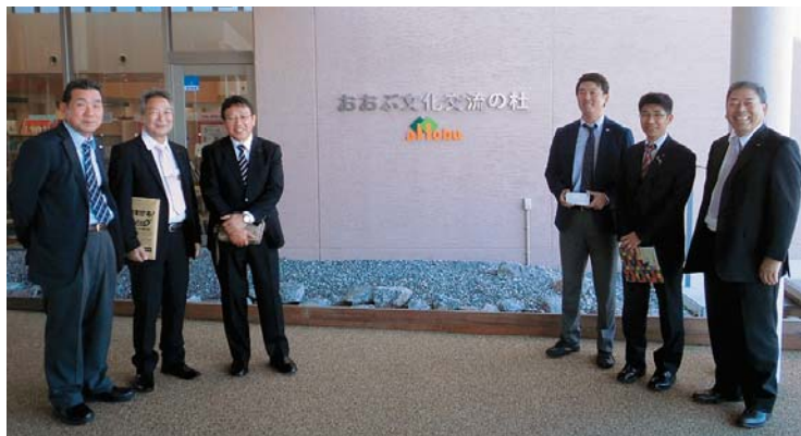
【所管事務調査（愛知県大府市） ～おおぶ文化交流の杜にて～

今後、多角的視点をもって、市民ニーズを市政へ繋げるよう取り組んでまいりたいと思っております。