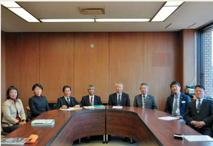
現在の委員構成は平成27年4月まで